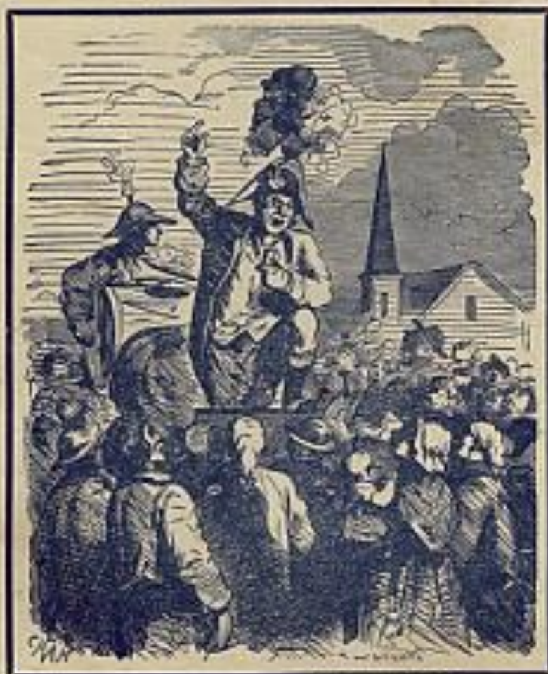
dessin original de CHAR