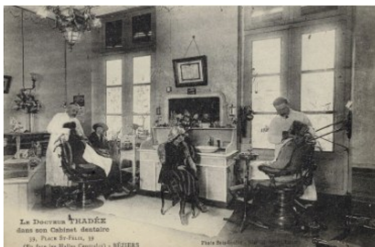
Cabinet dentaire du Docteur THADÉE Autre vue (Béziers)

Bois-Guillot (éditeur) - Blandel (éditeur)