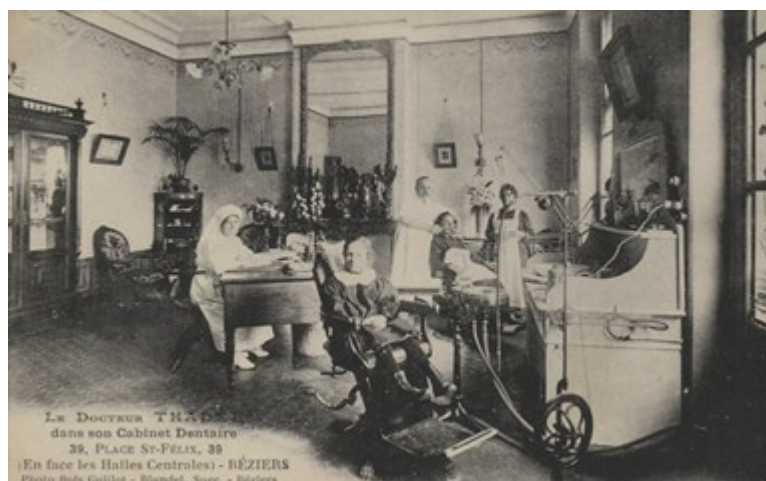
Cabinet dentaire du Docteur THADÉE Autre vue