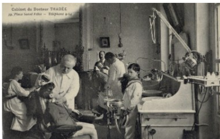
Carte éditée en 1986 par la firme CECODIL (91120 Palaiseau))