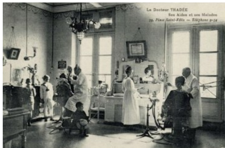
Cabinet dentaire du Docteur THADÉE

Document conservé aux Archives départementales de l'Hérault