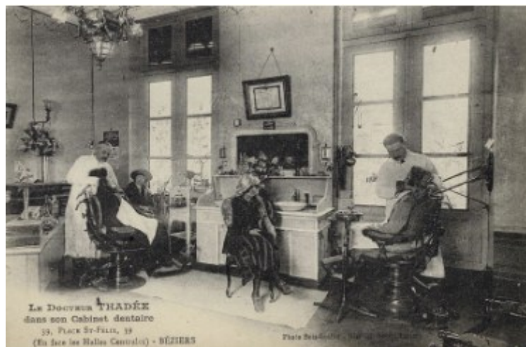
Cabinet dentaire du Docteur THADÉE