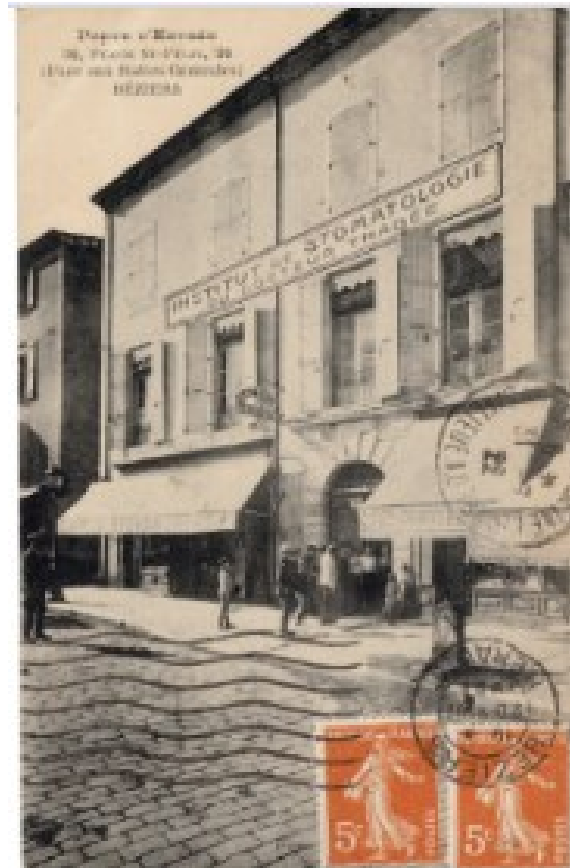
Institut de Stomatologie du Dr Thadée. 2 vues du coche d'entrée différentes (1922)