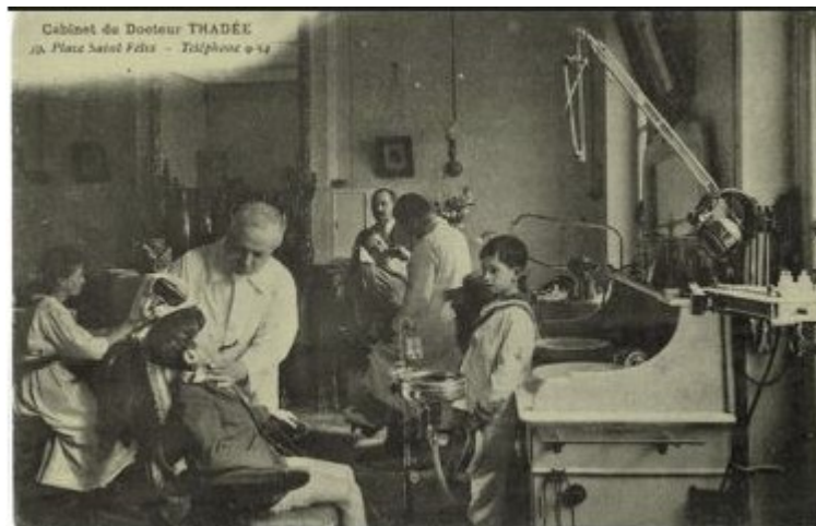
Très intéressante illustration d'un cabinet français entre les deux guerres.